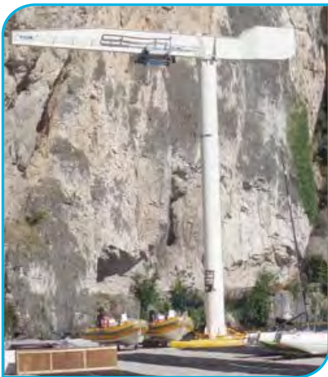
Gru a bandiera da 6000 kg